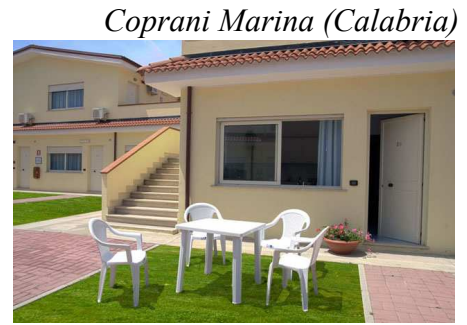
Coprani Marina (Calabria)

Il Villaggio Alemia (4 stelle) è situato a Coprani Marina, in provincia di Catanzaro, ben curato e immerso nel verde. Le camere, ampi bilocali, sono nuove, confortevoli e luminose, tutte ben arredate e dotate di giardino a piano terra o ampio terrazzo a primo piano, servizi privati, TV color 32 pollici, aria condizionata, minifrigido, cassetta di sicurezza e phon. Il Villaggio Alemia ha accesso ad una delle più belle spiagge della Calabria, sabbia fine e un fondale leggermente digradante ideale per i bambini. La spiaggia riservata agli ospiti è attrezzata con sdraio e ombrelloni dista 300 metri comodamente raggiungibile lungo un sentiero o comodamente con un efficiente servizio navetta. Il Villaggio Alemia dispone di una ampia piscina attrezzata con doppia profondità per la sicurezza dei bambini. Ottima Animazione per grandi e piccini, intrattenimento serale e diurno.